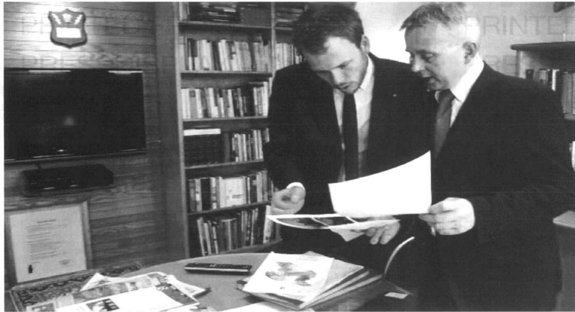
ADVARER: Justisminister Knut Storberget og barneminister Audun Lysbakken ga i går en felles advarsel til trossamfunn og andre som tror at taushetsplikten står over straffeloven. – Trossamfunn er ingen frisoner. Overgrep mot barn skal anmeldes, og plikten til dette skjerpes og klargjøres, skrev Lysbakken på Twitter.